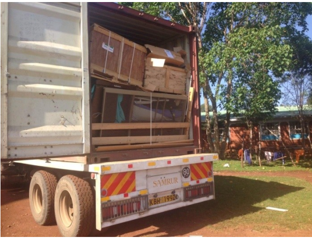
De container heeft Kenia bereikt en de spullen zijn in Kisumu